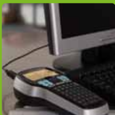
PC / Mac®