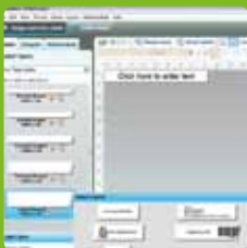
Logiciel DYMO Label™ v.8